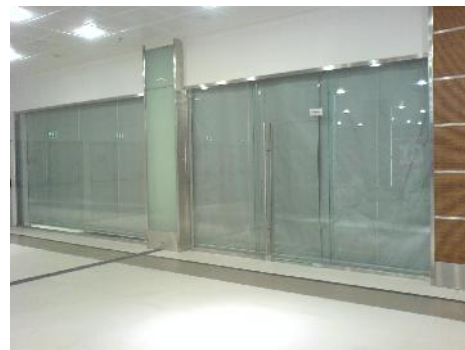
ΚΑΤΑΣΤΗΜΑ L.A. HAIR DRESSING THE MALL ATHENS