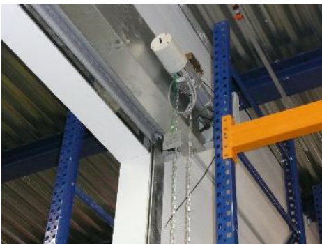
ΓΕΡΟΥΜΑΤΟΣ ΚΤΙΡΙΟ ΔΑΙΔΑΛΟΣ